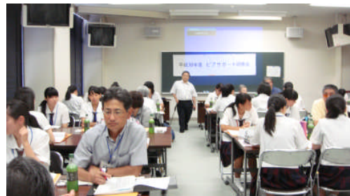
ピアサポート研修会 盛岡会場