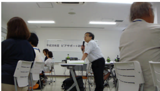
ピアサポート研修会 一関会場

メール：(難病) iwanan@io.ocn.ne.jp (小児) iwanan.shoman@dune.ocn.jp